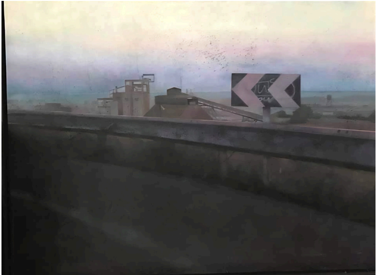
Claudio Sánchez Domínguez Señales . Mixta sobre lienzo. 97 x 130 cm.