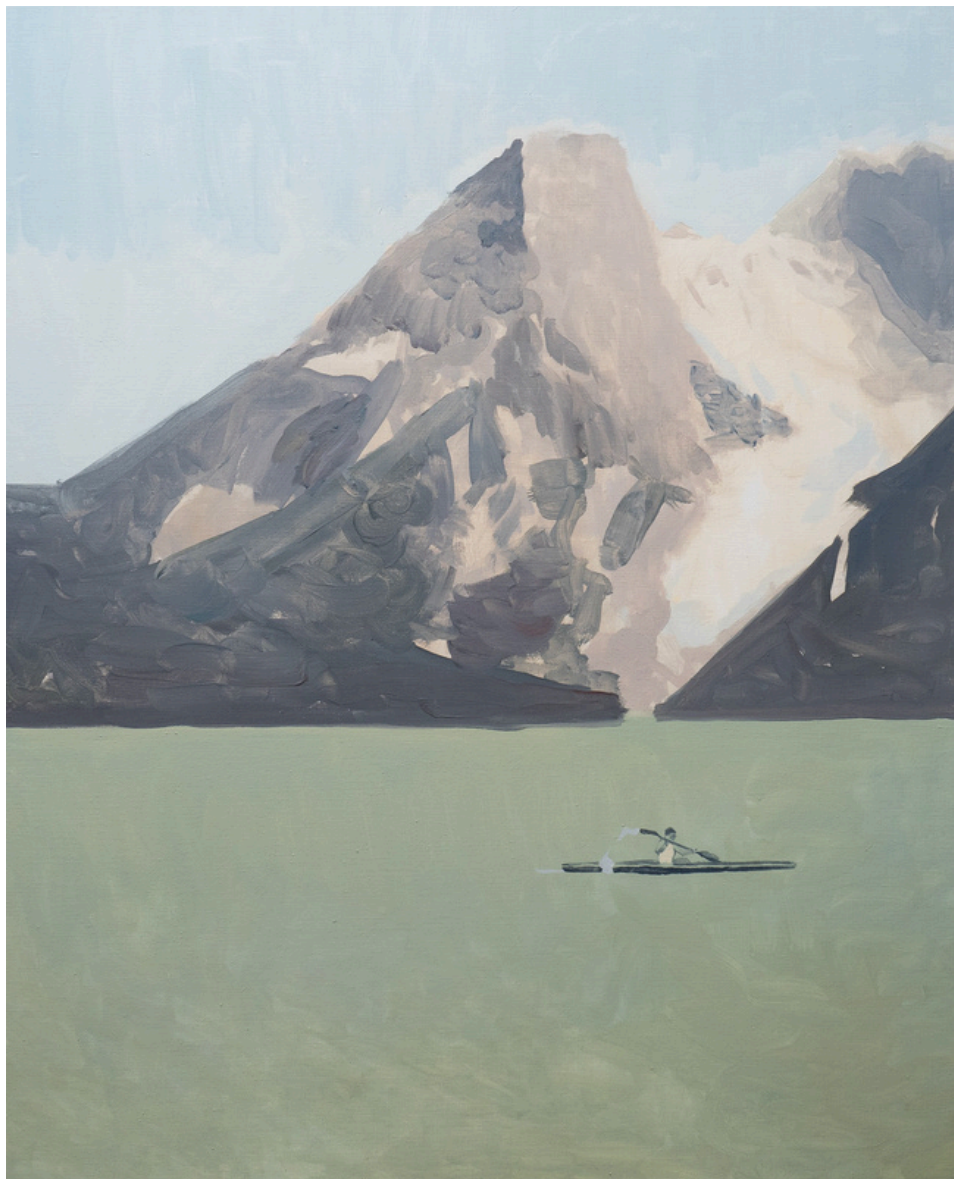
Diego Carmona Roldán Saudade. Óleo sobre lienzo, 100 x 81 cm.