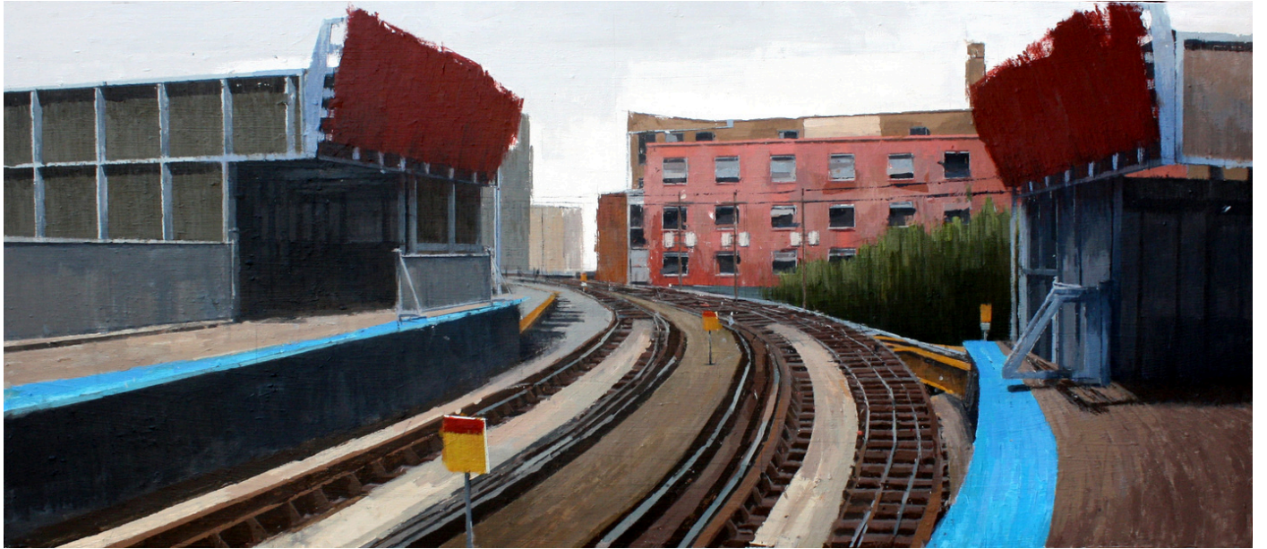
Guillermo Masedo Andén azul y rojo . Acrílico sobre tabla, 60 x 140 cm.