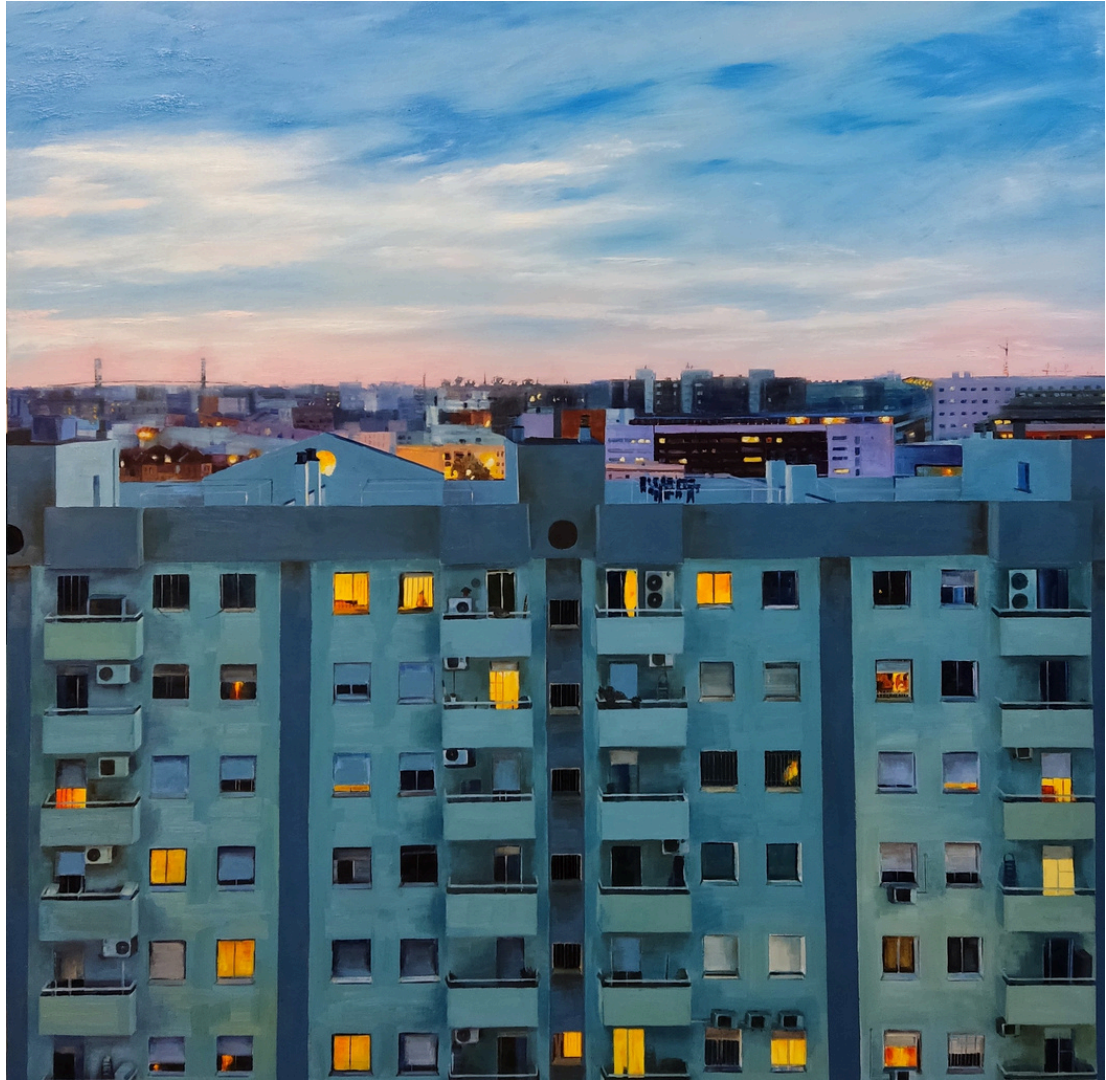
Carmen Sánchez Ruda Desde mi ventana. Óleo sobre lienzo, 92 x 92 cm