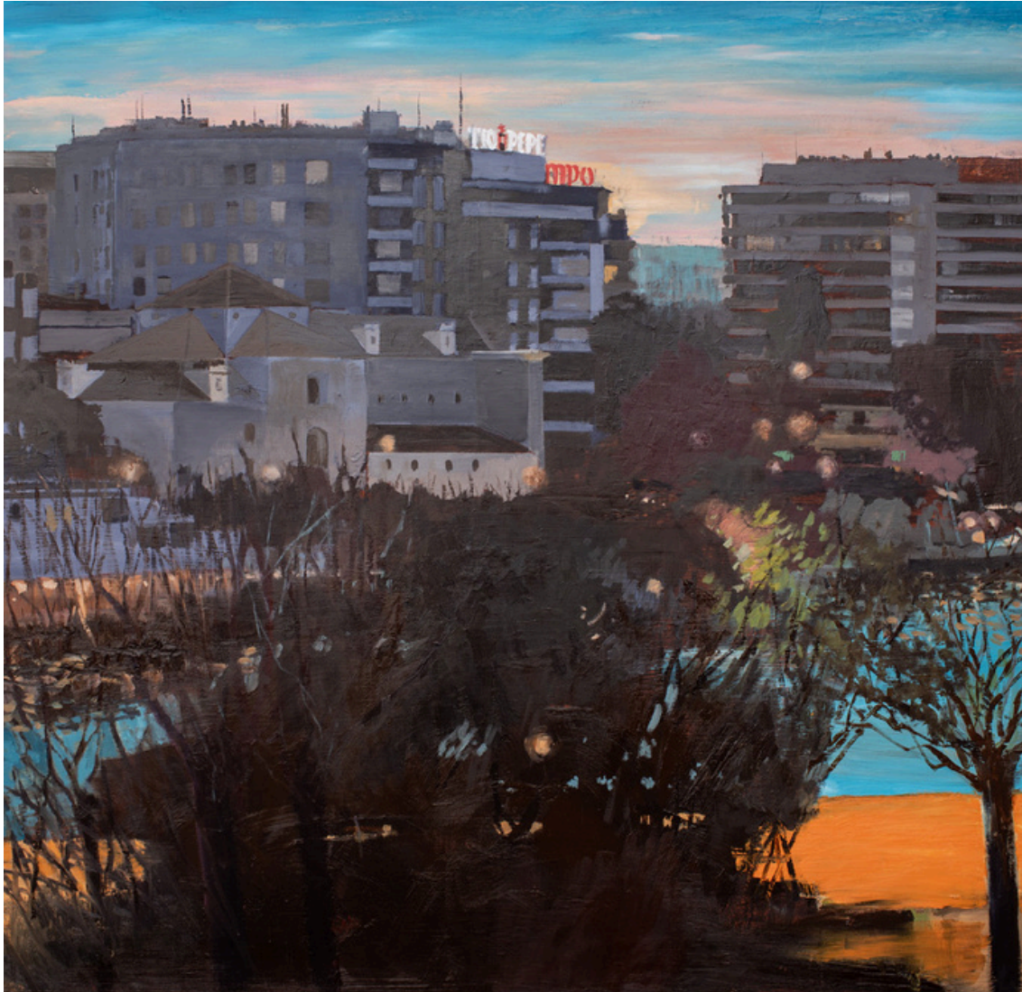
Benjamín Castillo Barragán Plaza de Cuba . Óleo sobre tabla, 121 x 121 cm.