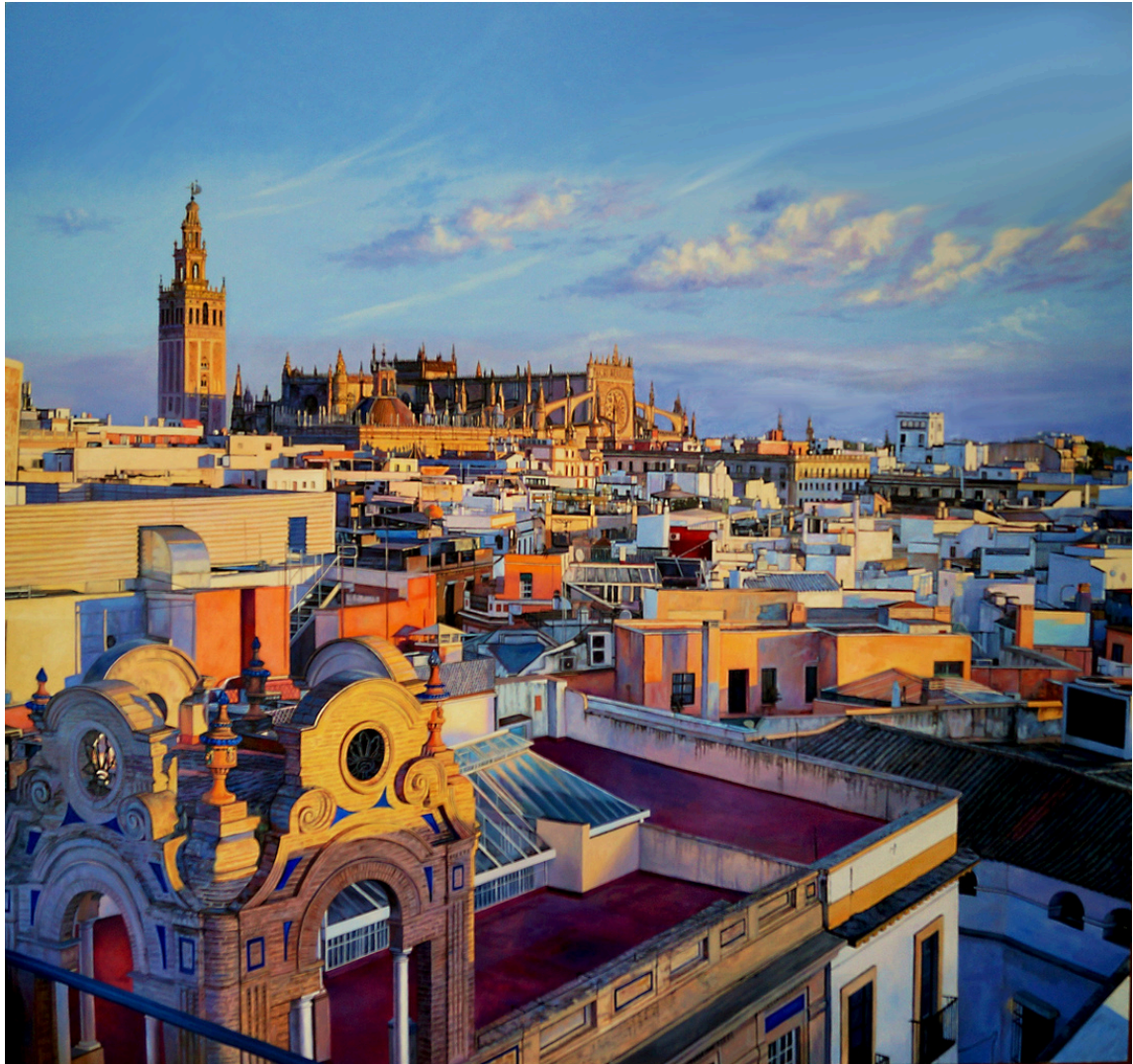
Christian Castro Martínez Atardecer en Sevilla . Óleo sobre tabla, 130 x 122 cm.