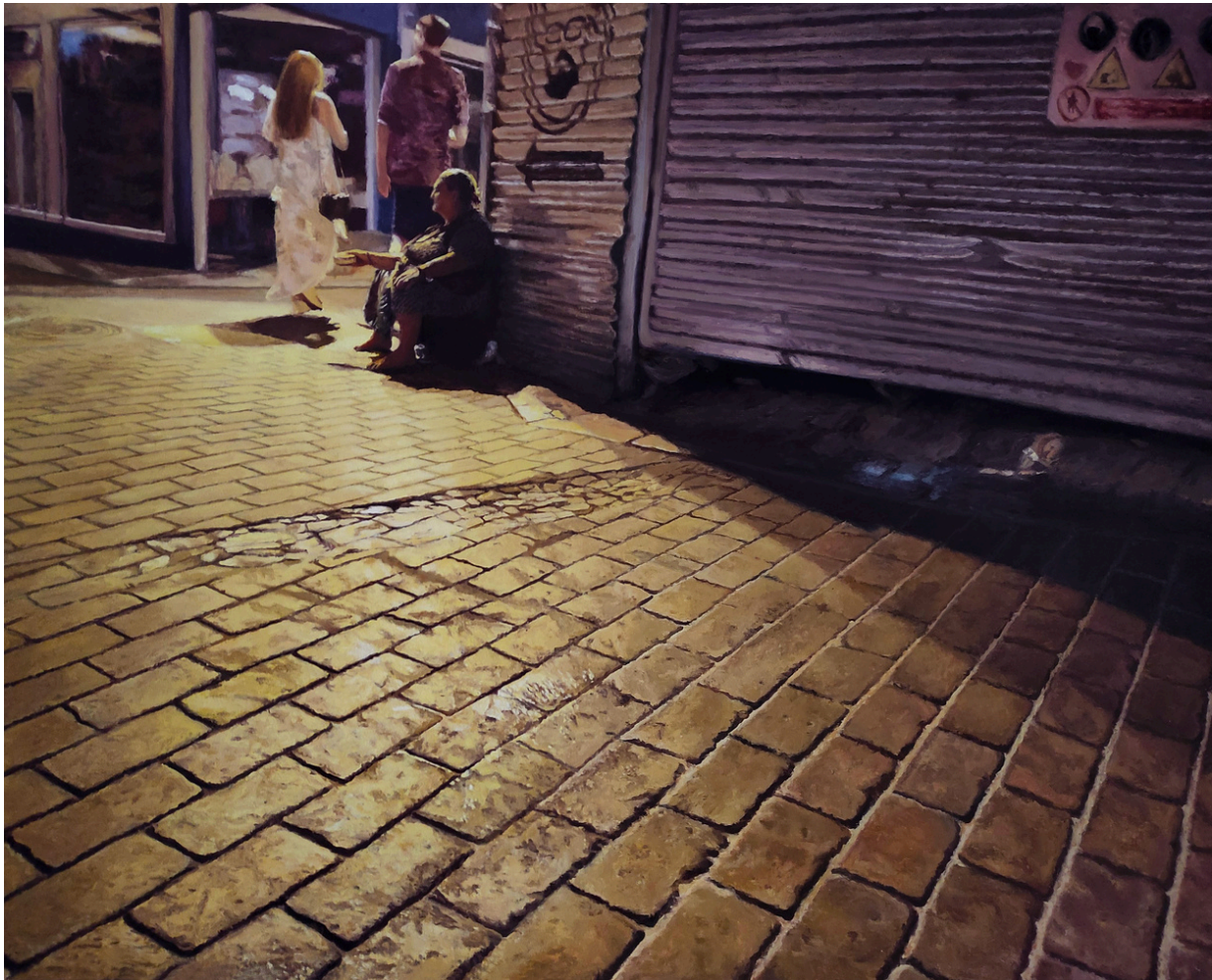
Raúl Collado Herreros Fuiste la niña de azul . Óleo sobre lienzo, 65 x 81 cm