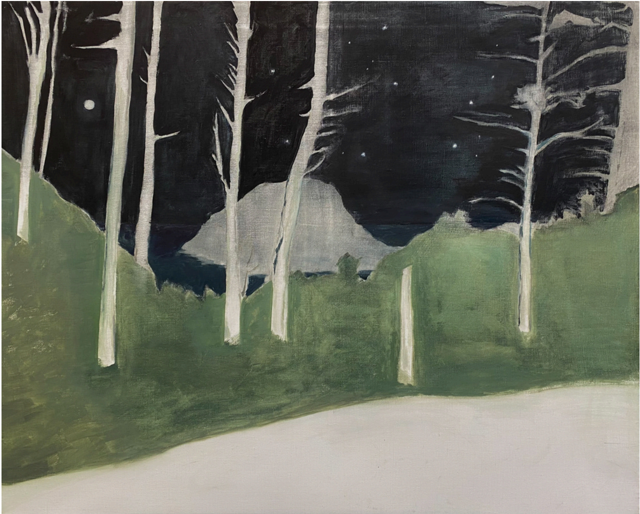
Rocío Olalla Villar Canobolas . Óleo sobre lino, 81 x 100 cm.