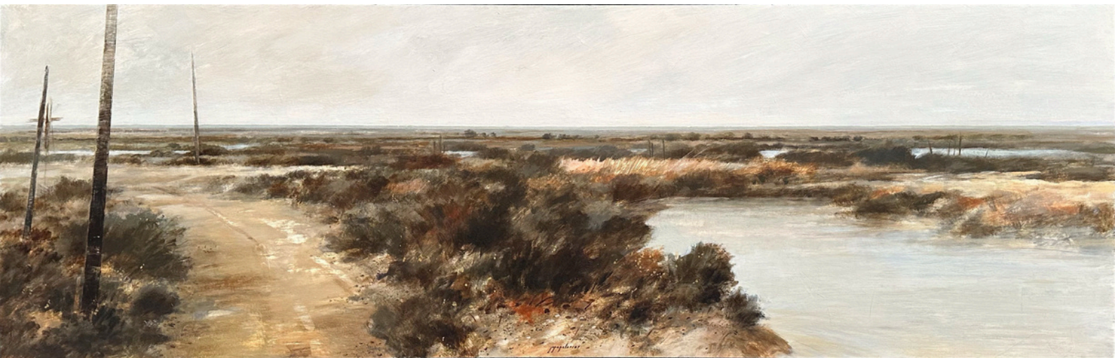
Pepe Palacios Marismas . Óleo sobre tabla, 50 x 150 cm.