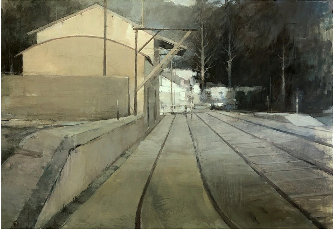
Francisco Martín Barea Estación de Cazalla . Acrílico sobre lienzo, 81 x 116 cm.