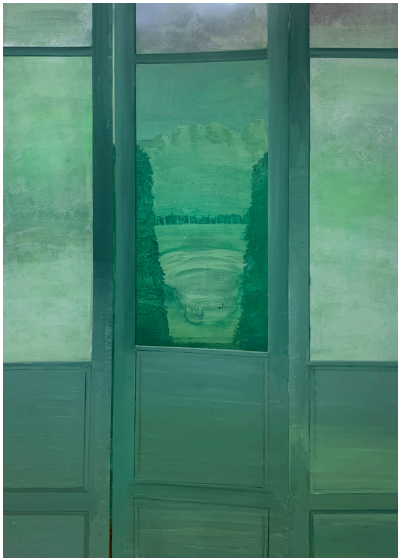
Amara Clara Sánchez Domínguez Puerta II. Mas allá del jardín habitan las bestias Óleo sobre lienzo, 140 x 100 cm