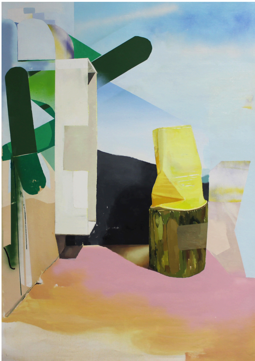
Jesús Jiménez Medina Noches Blancas . Técnica mixta sobre lienzo, 140 x 100 cm.