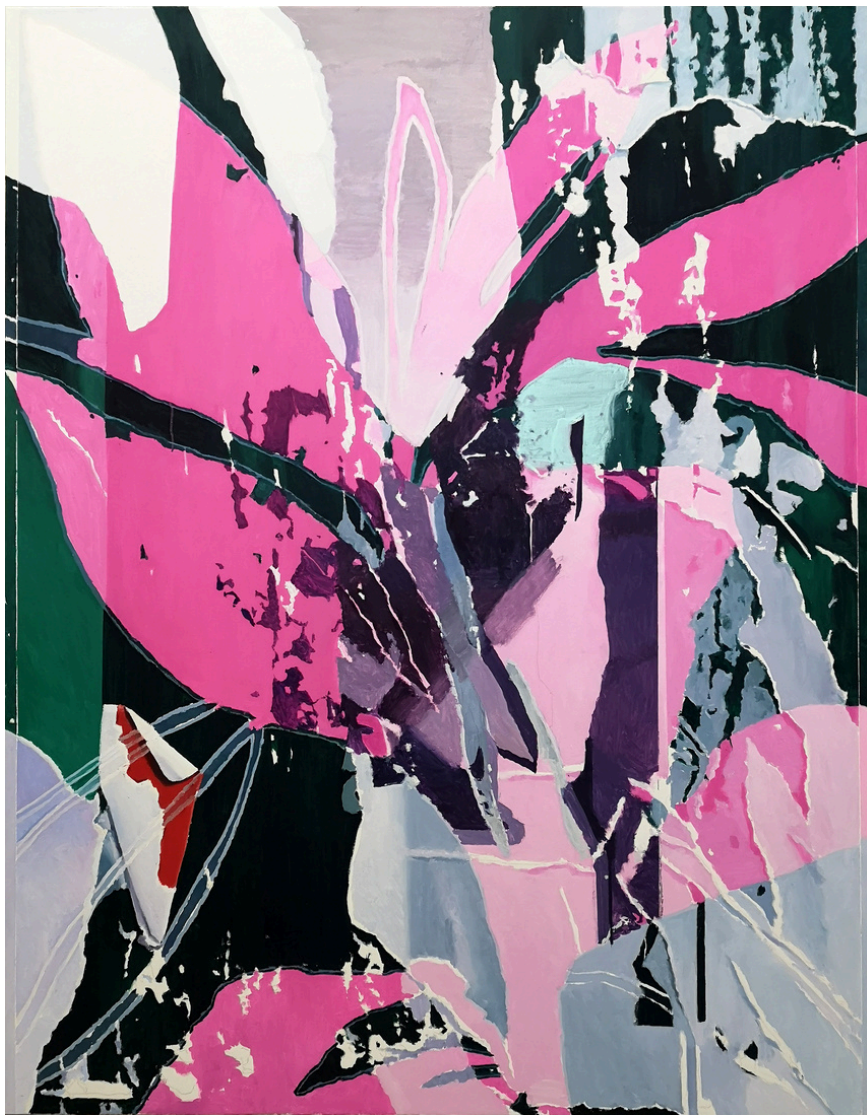
Jesús Puente Carretero Recorte de Paisaje. Óleo sobre lienzo, 146 x 114 cm.