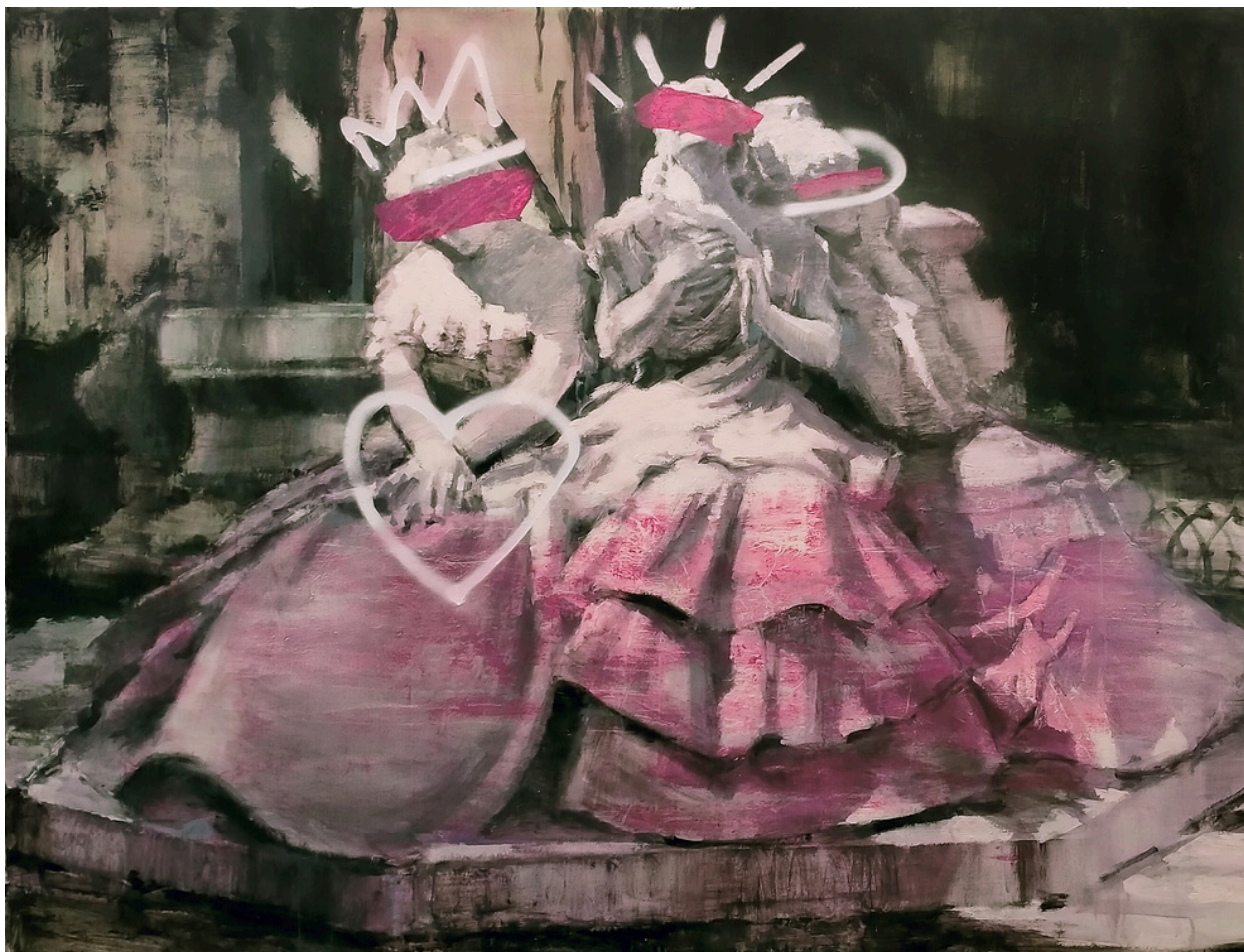
Miguel Bastante Recuerda El amor ilusionado, el amor poseído y el amor perdido de Bécquer. Técnica mixta, 150 x 114 cm