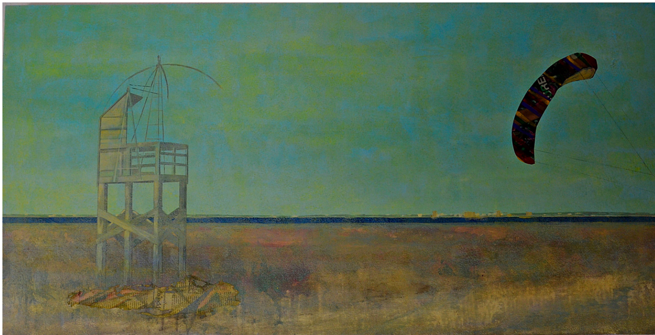
Curro Torres Plage du Cormier . Técnica mixta sobre tabla, 60 x 120 cm.