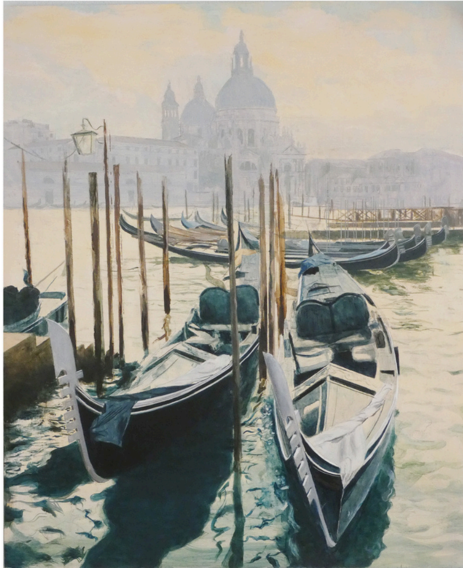
Carmen Teresa Librero Vilches L'ultimo tramonto . Óleo sobre tabla, 73 x 65 cm