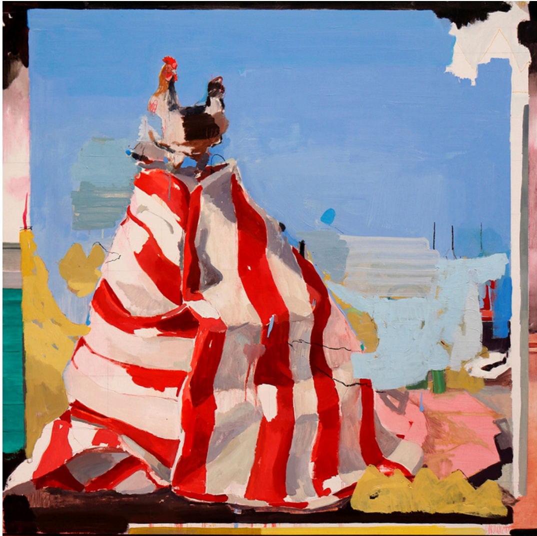
Menchu León Rodríguez El exilio de Capi . Óleo y ceras sobre tabla, 100 x 100 cm