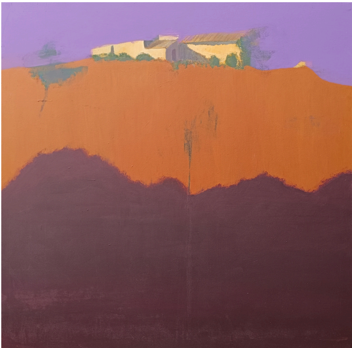
Santiago Castillo Trigos Ermita de San Roque . Acrílico sobre lienzo, 130 x 130 cm.