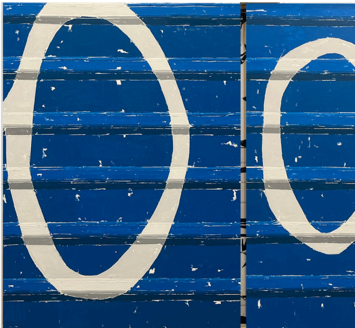
Andrés Aparicio Castellano Paisaje con esfinge . Óleo sobre lienzo, 60 x 70 cm.