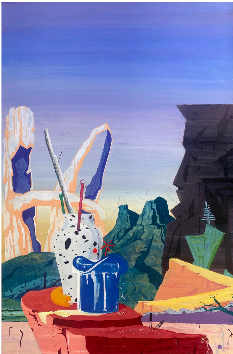
Juan Manuel Benítez Grima Untad mi colonia en la nariz del galgo. Óleo sobre lienzo, 146 x 97 cm.