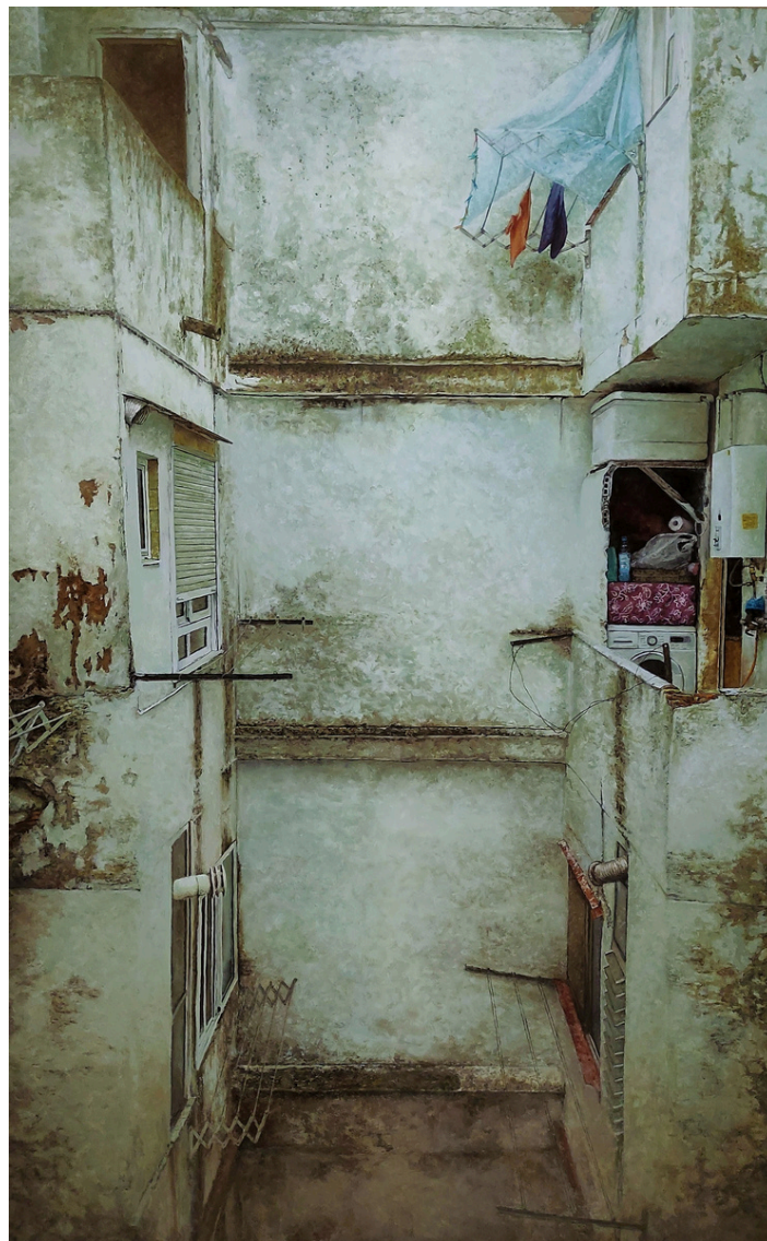
Raúl Collado Herreros La torre de Babel . Óleo sobre lienzo, 130 x 81 cm.