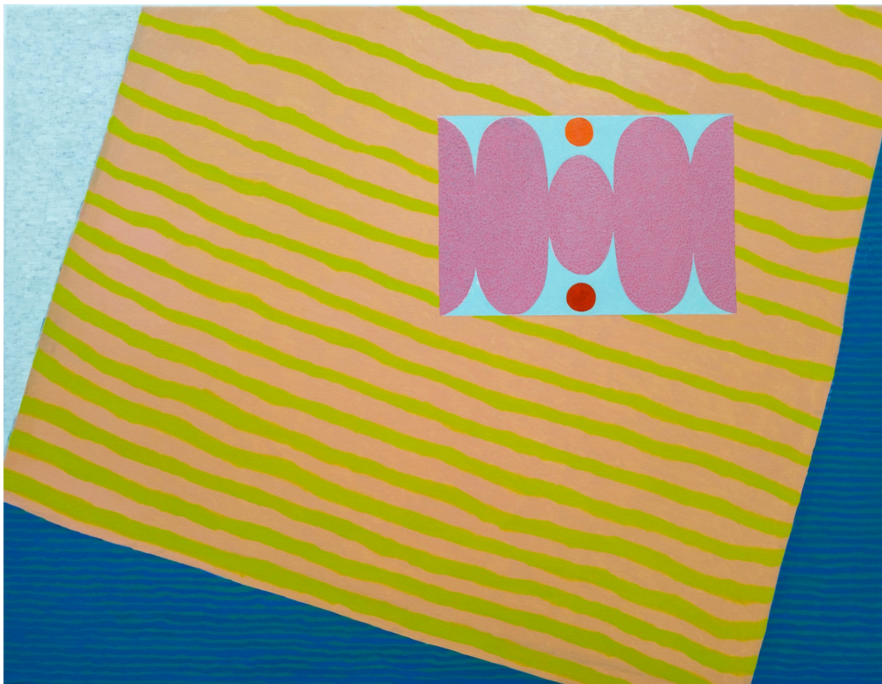
Federico Jaime López El último verano . Óleo sobre lienzo, 89 x 116 cm.