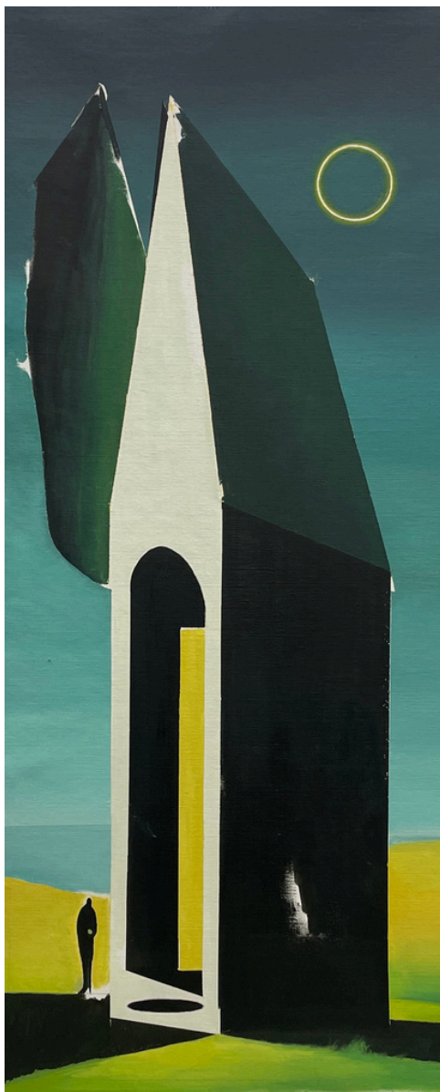
Israel Tirado García El hombre del mar . Óleo sobre madera, 50 x 120 cm.