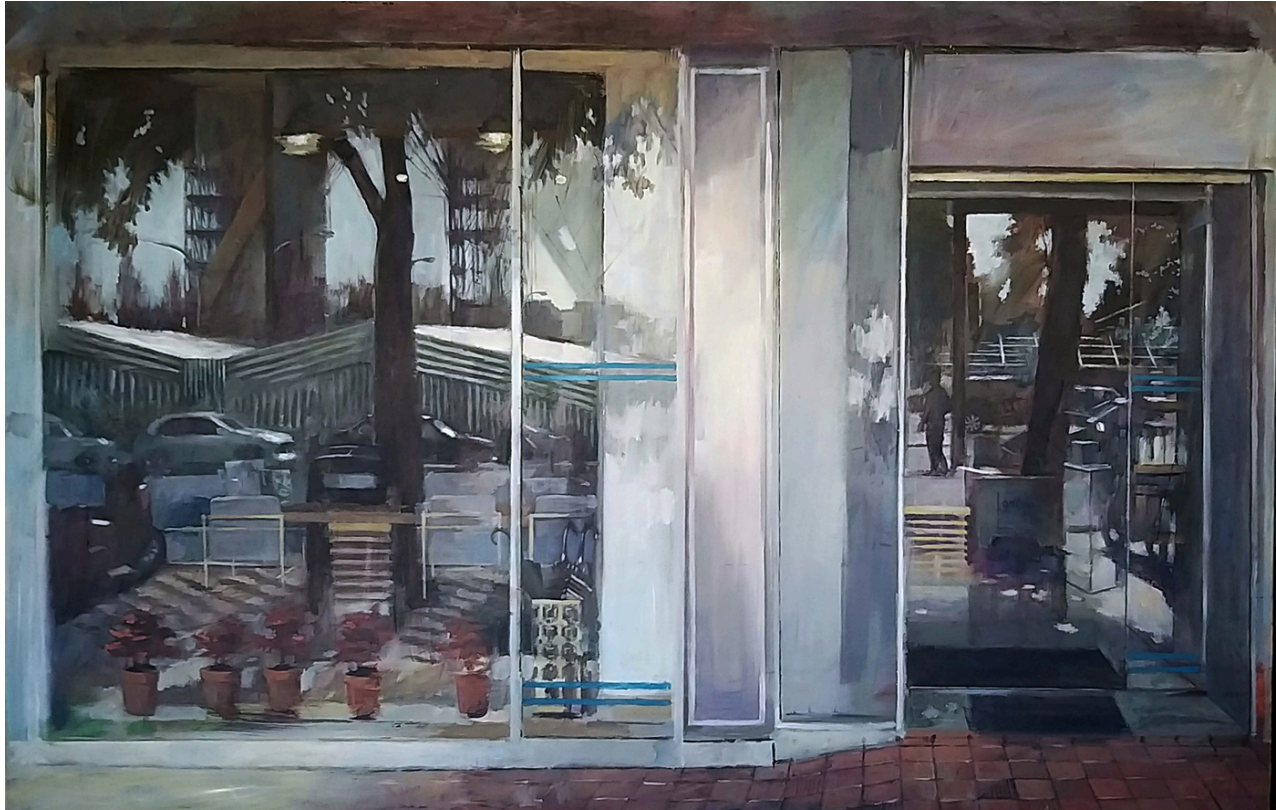
Francisco Javier Montes García Montando la feria . Óleo sobre lienzo, 150 x 150 cm.