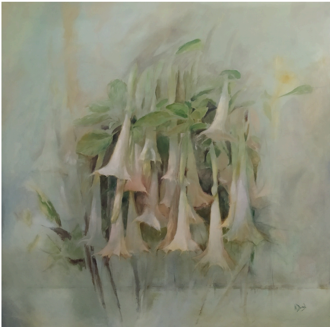
Antonio Dorado Guerra Datura arborea trompetera . Óleo sobre lienzo, 100 x100 cm.