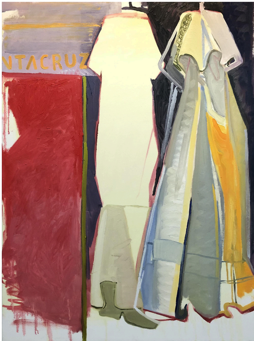
Amapola Jiménez Aguilera Sombrillas flotantes . Óleo sobre lienzo, 73 x 54 cm.