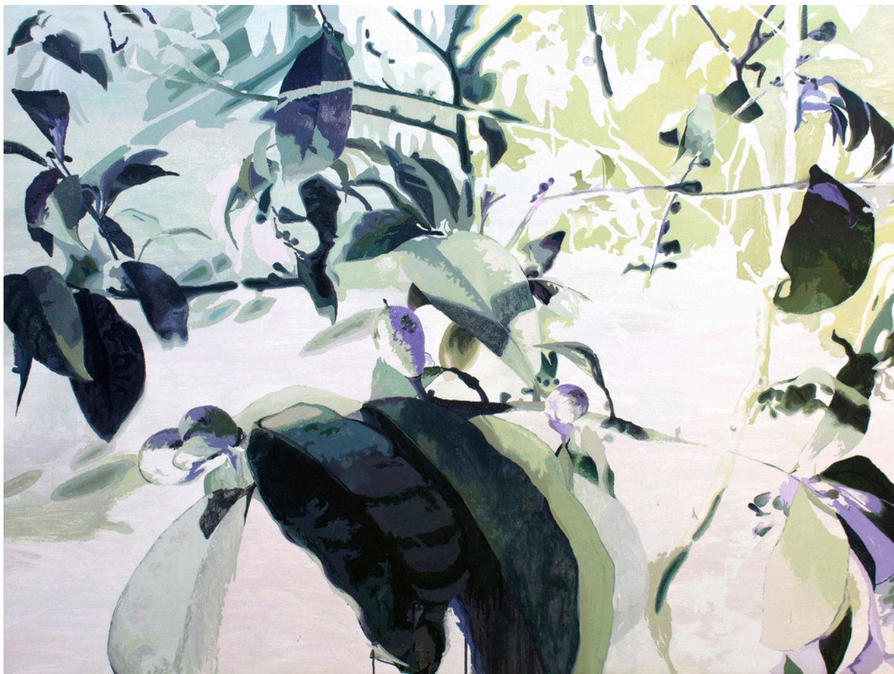
Emilio Nieto Gómez Fragmento de Jardín . Óleo sobre lino, 110 x 145 cm.