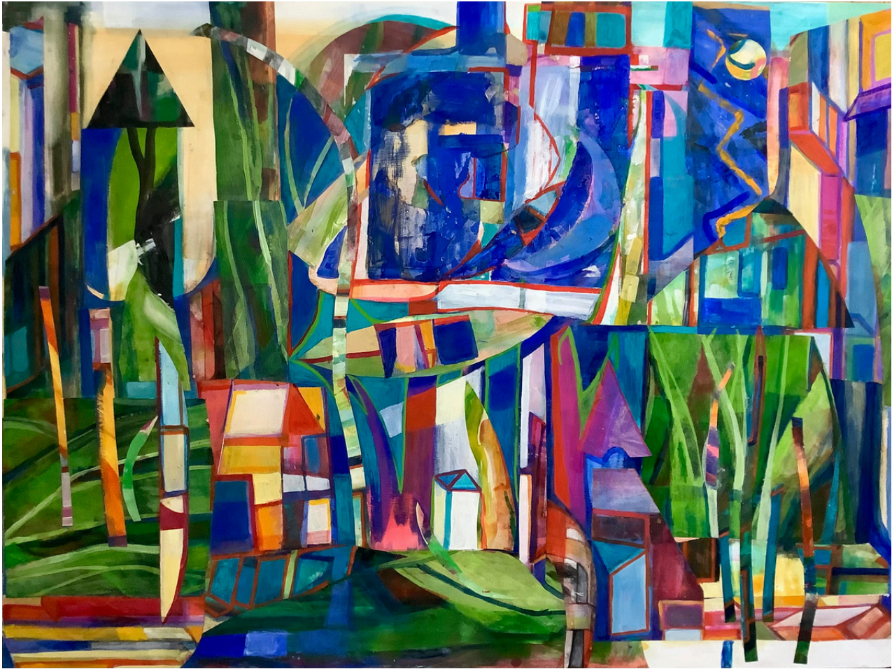
Leonor de Carlos Barmudo Promenade . Técnica mixta sobre tabla, 90 x 120 cm