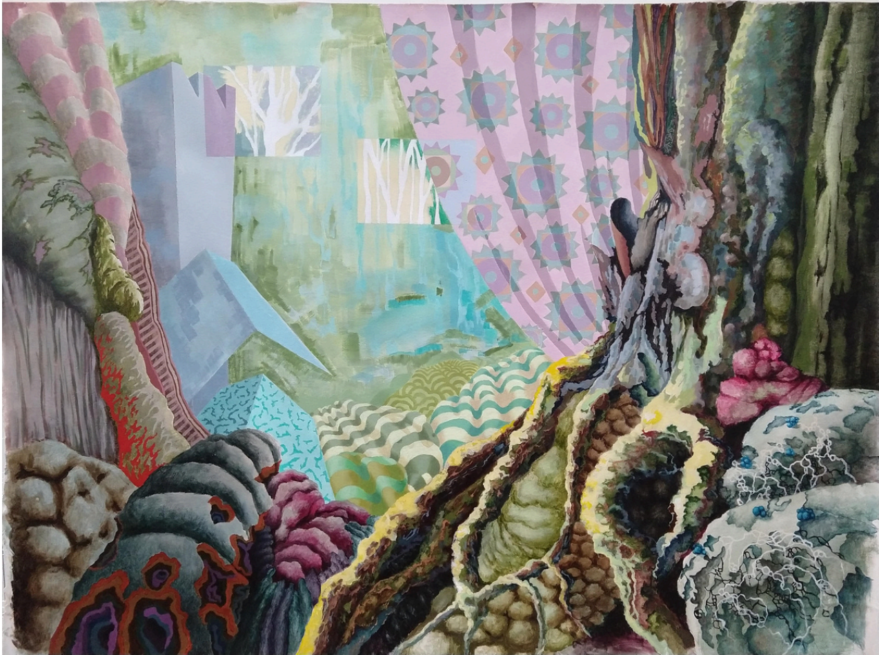
Araceli Parra Malagón Entre cortinas . Acrílico sobre algodón, 97 x 130 cm.