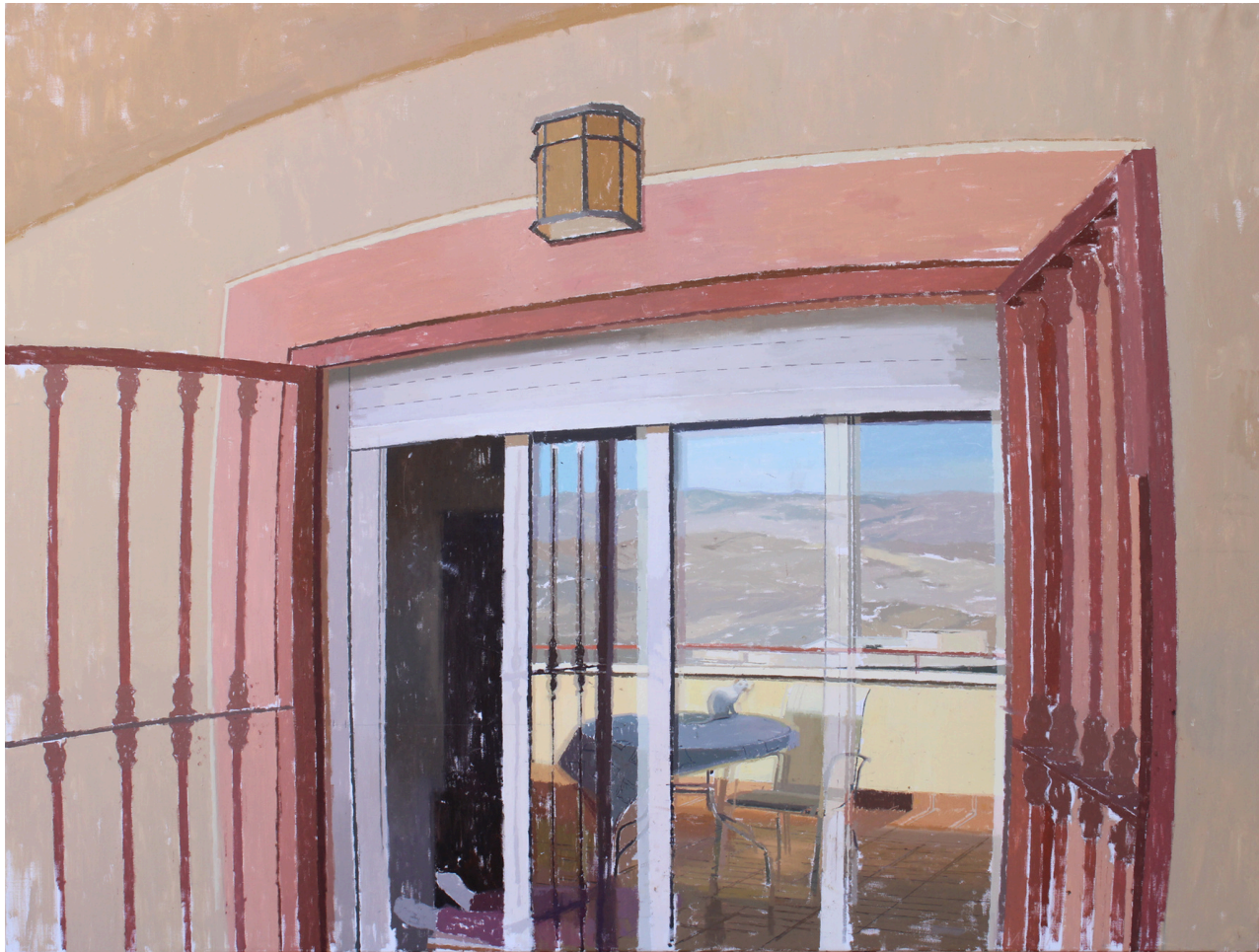
Antonio Lara Luque Escena en la sierra de los Filabres. Óleo sobre lienzo, 150 x 114 cm.