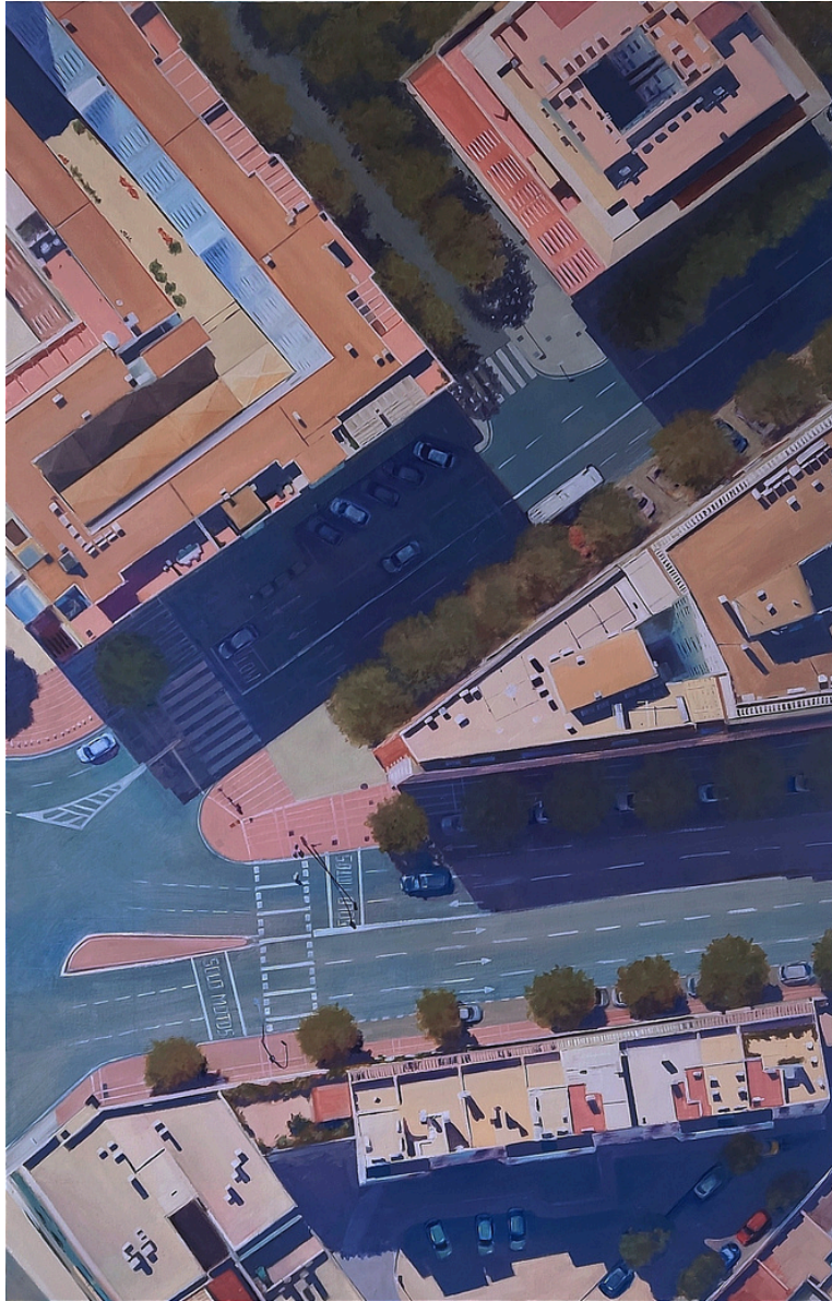
Carmen Sánchez Ruda UP. Óleo sobre lienzo, 100 x 65 cm.